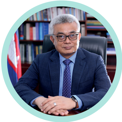
អគ្គបណ្ឌិតសភាចារ្យ អូន ព័ន្ធមុនីរ័ត្ន ឧបនាយករដ្ឋមន្ត្រី រដ្ឋមន្ត្រីក្រសួងសេដ្ឋកិច្ច និងហិរញ្ញវត្ថុ

សុខសន្តិភាព និង ស្ថិរភាពនយោបាយ ដែលទទួលបាន ក្រោមការដឹកនាំប្រកបដោយគតិបណ្ឌិត និង ចក្ខុវិស័យវែង ឆ្ងាយរបស់ សម្តេចអគ្គមហាសេនាបតីតេជោ ហ៊ុន សែន នាយករដ្ឋមន្ត្រីនៃព្រះរាជាណាចក្រកម្ពុជា បានធ្វើឱ្យកម្ពុជាមាន ការអភិវឌ្ឍសង្គម-សេដ្ឋកិច្ចជាតិយ៉ាងឆាប់រហ័ស ជាមួយនឹង សមិទ្ធផលច្រើនឥតគណនា គួរជាទីមោទនៈ។ កិច្ចអភិវឌ្ឍលើ គ្រប់វិស័យ ដើម្បីសម្រេចបាន ជាប្រទេសមានចំណូលមធ្យម កម្រិតខ្ពស់ តាមរយៈ យុទ្ធសាស្ត្រចតុកោណដំណាក់កាលទី ៤ នីតិកាលទី ៦ នៃរដ្ឋសភា គឺ “កំណើន ការងារ សមធម៌ និង ប្រសិទ្ធភាព : កសាងមូលដ្ឋានឆ្ពោះទៅសម្រេចចក្ខុវិស័យកម្ពុជា ឆ្នាំ ២០៥០” ធ្វើឱ្យជីវភាពប្រជាជនមានភាពល្អប្រសើរឡើង ។